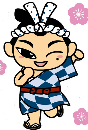
下市町マスコットキャラクター ごんたくん